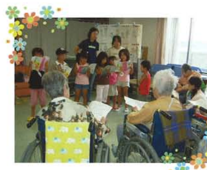
子供達による歌の発表会