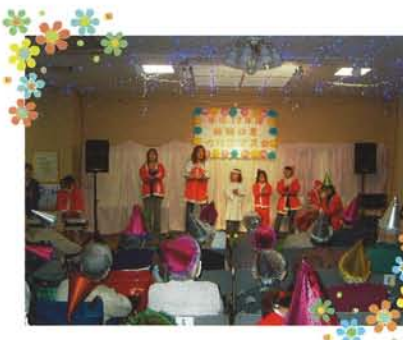
クリスマス会 演奏会