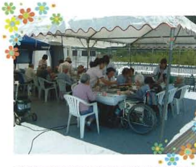
屋上にてバーベキュー！！