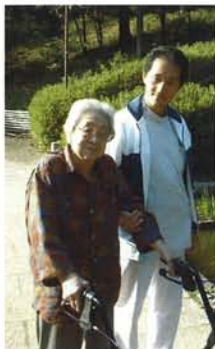
郊外レクリエーションでの 歩行訓練風景

次年度は、「人間らしく活き 活きと生きる」とは？」をテーマ に、ご利用者様一人一人の思い を尊重し、前向きに心豊かに人 生を歩んでいただくお手伝い ができたら・・・と考えてい ます。