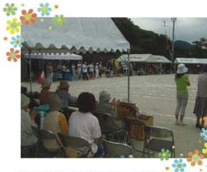
北醍醐小学校区運動会見学