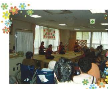
まりもの会（ボランティア）