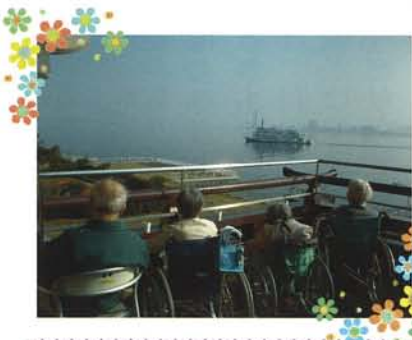
琵琶湖大津会館からの絶景