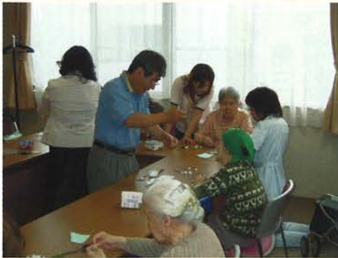
オリジナル手芸教室 レース*ブルーム (ボランティア)によるレクリエーション

今年、おかげさまで六年目を迎 えようとしているなか、「リハビ リテーションとは？」という初心 を、私を含め職員全員が忘れてき てはないだろうか・・・と不安 に思うことがあります。