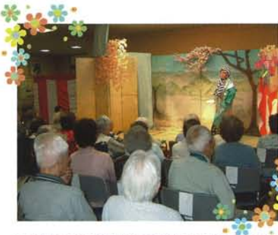
万里の会（ボランティア）